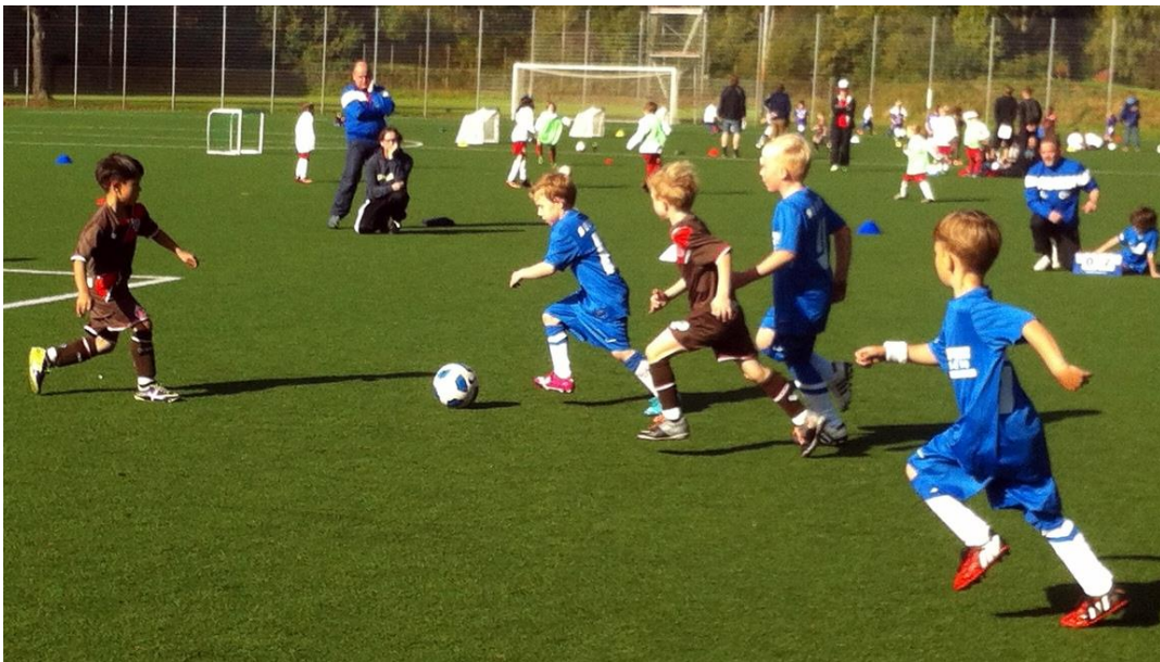
Abbildung 2 - FUNiño-Turnier im Sommer 2014 in der Altersklasse 6-7Jahre, alle Kinder sind in Bewegung, die Erwachsenen sind stille Beobachter

Stattdessen begibt sich der Trainer anschließend durch das Fragen und die gemeinsame Erörterung auf Augenhöhe mit den Kindern und behandelt sie gleichberechtigt. Er hilft den Kindern, selbst Defizite zu erkennen und eigene Lösungen zu finden – er hilft den Kindern es selbst zu tun und fördert somit die Unabhängigkeit des Kindes vom Erwachsenen. Kinder lernen wirksamer und anhaltender, wenn sie ihre Fehler selbst überprüfen und korrigieren können. Dennoch brauchen Kinder neben den kindgerechten Lernangeboten Vorbilder.